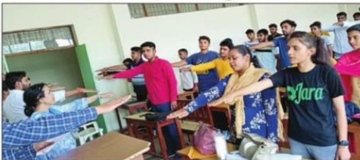
बिरोहड़ राजकीय कॉलेज में छात्रों को शपथ दिलाते शिक्षक।