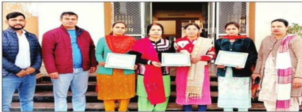
विजेता छात्राओं को सम्मानित करते स्टाफ सदस्य। संवाद