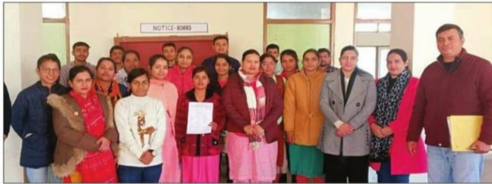
राजकीय महाविद्यालय बिरोहड़ में एचआईवी के बारे में जागरूकता अभियान में शामिल छात्राएं।