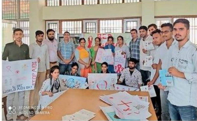
बिरोहड़ के राजकीय महाविद्यालय में आयोजित स्पर्धा में शामिल हुए विद्यार्थी।