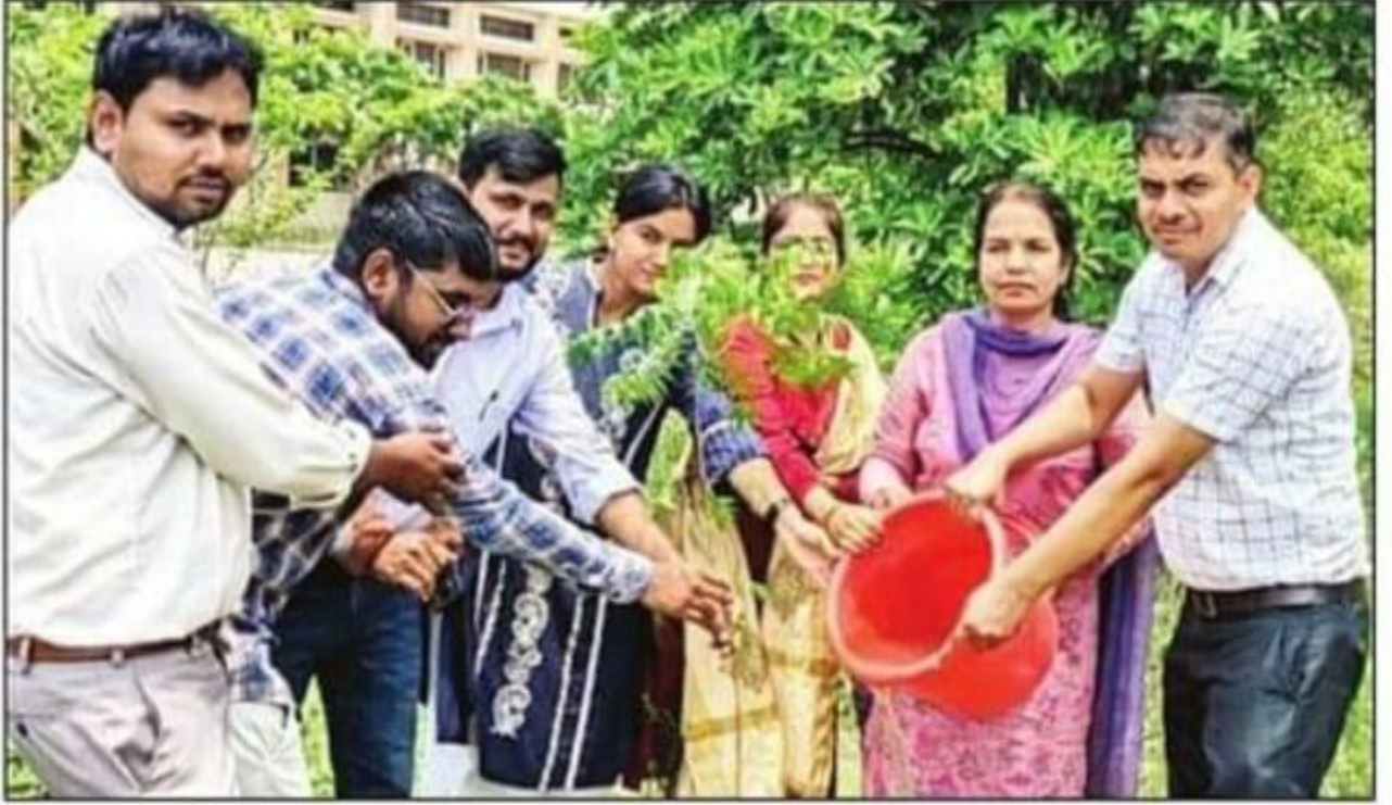
राजकीय कॉलेज बिरोहड़ में वृक्षरोपण करते शिक्षक। संवाद