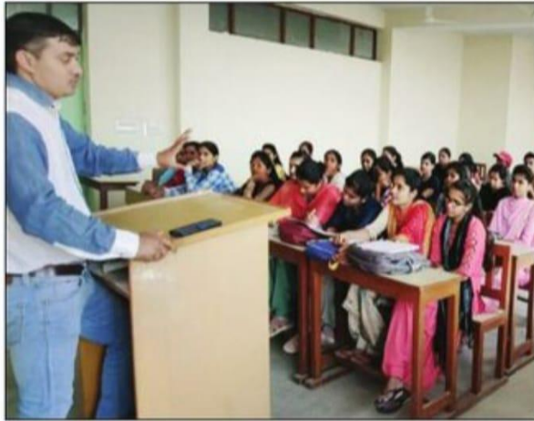
राजकीय कॉलेज बिरोहड़ में व्याख्यान देते हुए सहायक प्रोफेसर।