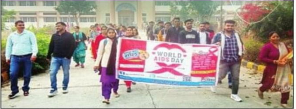
बिरोहड़ कॉलेज में एड्स दिवस पर रैली निकालती छात्राएं। संवाद