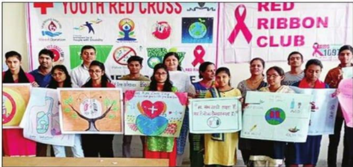
गांव बिरोहड़ के राजकीय कॉलेज में पोस्टर दिखाती छात्राएं।