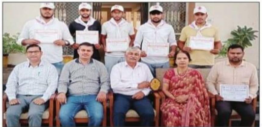
विरोहड़ राजकीय महाविद्यालय में स्वयंसेवकों को सम्मानित करते शिक्षक।