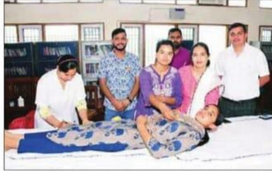
रक्तदान शिविर में रक्तदाता को बैंड लगाकर सम्मानित करते आयोजक।