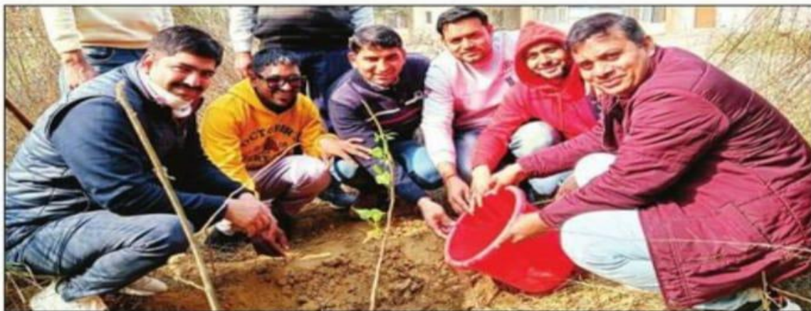
पौधरोपण करते स्टाफ सदस्य।