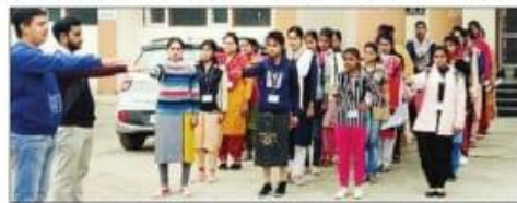
बिरोहड़ राजकीय कॉलेज में एड्स के प्रति जागरूक करने की राफ़्त लेते स्वयंसेवक।