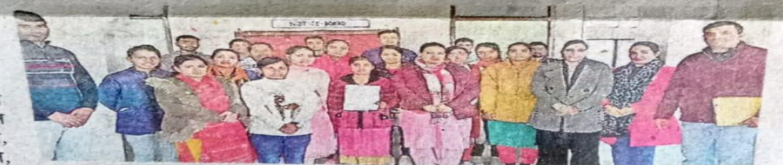
गांव बिरोहड़ के सरकारी कालेज में एड्स से बचाव को लेकर जागरूकता फैलाने के लिए हस्ताक्षर अभियान चलाते विद्यार्थी।